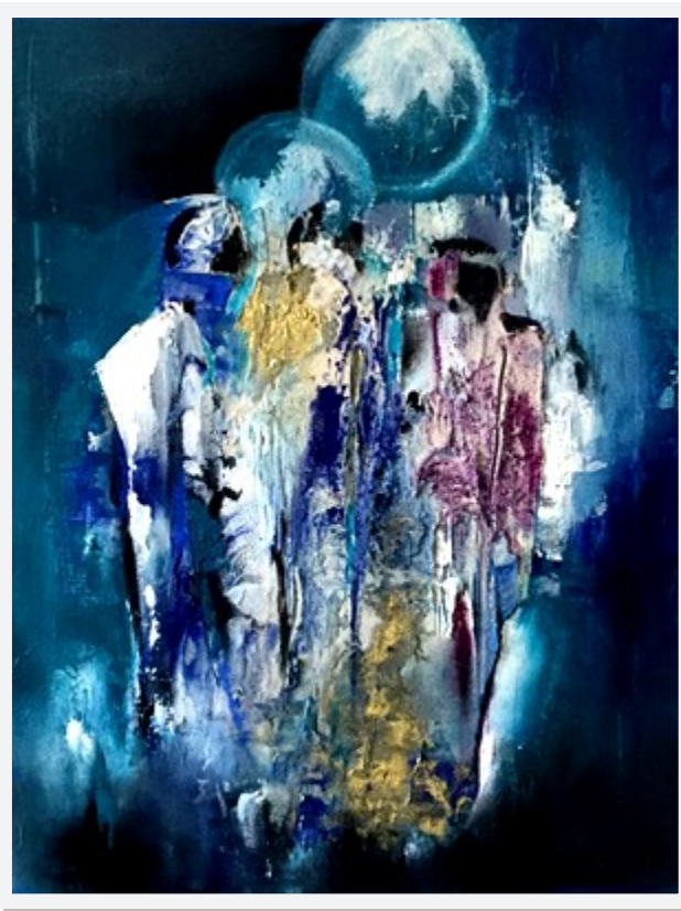
« SANS TITRE »

Technique mixte sur toile 40 x 50 - Prix de réserve : 180 €