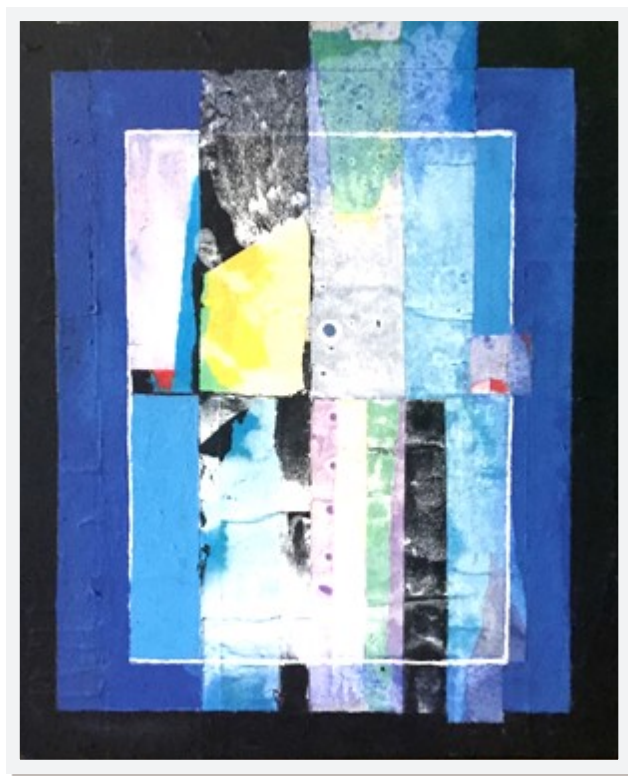
« SANS TITRE »

Papiers déchirés et acrylique sur toile 38 x 46 - Prix de réserve : 180 €