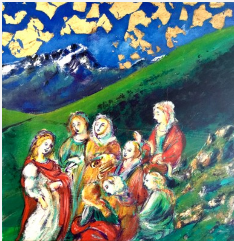
« MUZELLE ET MUSES »

acrylique sur marouflage 30 x 30 - Prix de réserve : 160 €