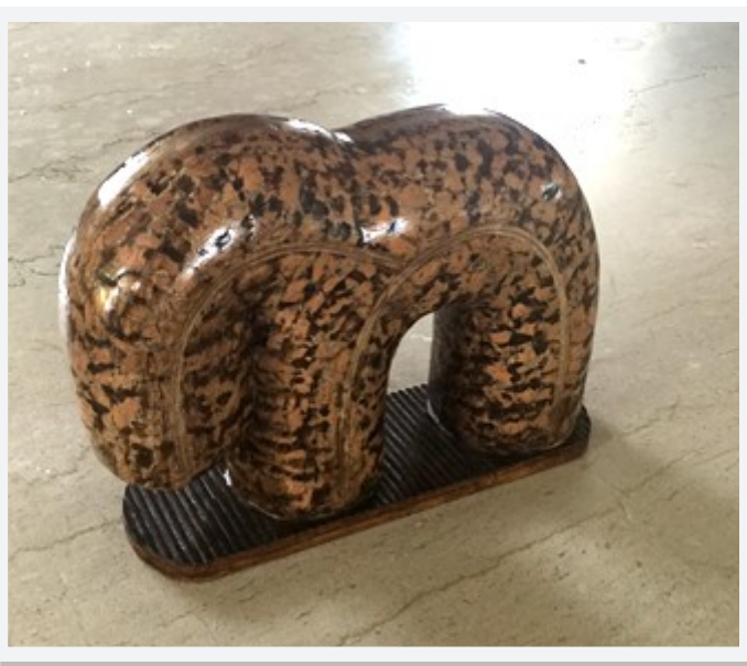
« SANS TITRE »

Sculpture / coquilles de noix 27 x 21 - Prix de réserve : 210 €