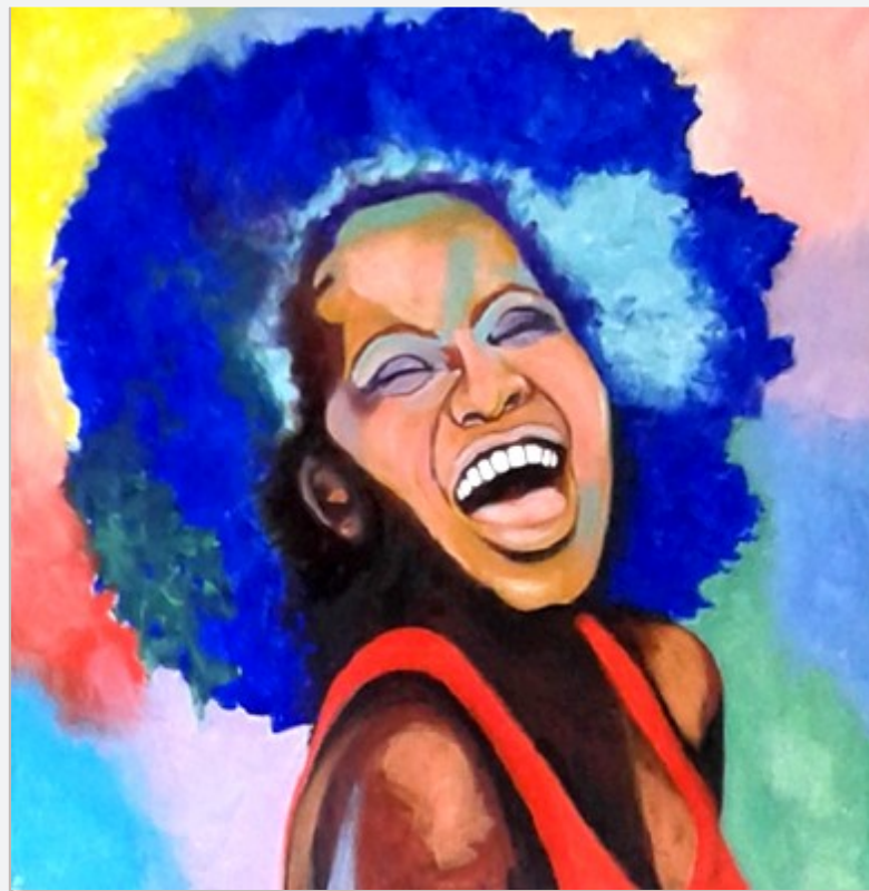
« LA RIEUSE »

Huile sur toile 60 x 60 - Prix de réserve : 180 €