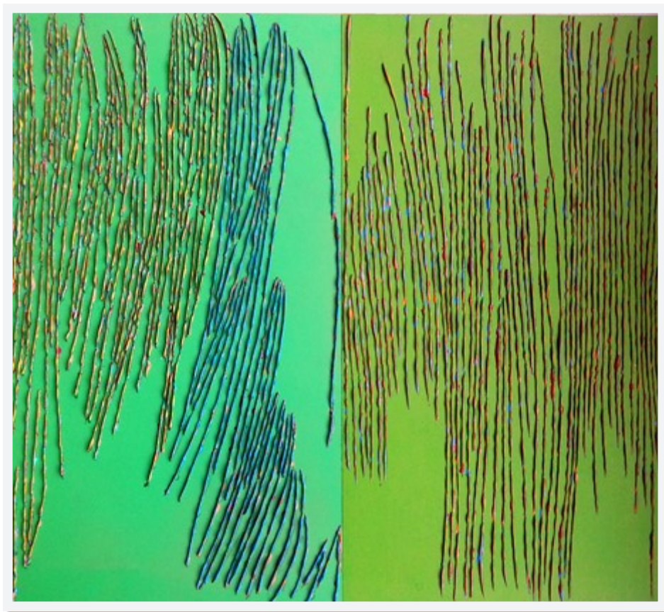
« DIPTYQUE »

Acrylique sur bois 49 x 51 - Prix de réserve : 220 €